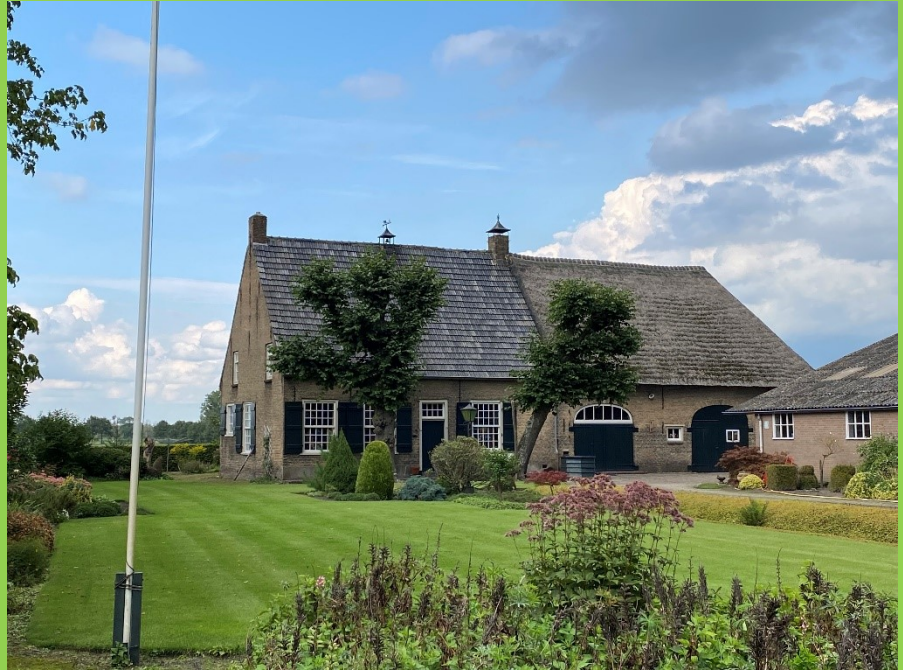
Verstoep in Markdal: Hoeve Bos uit 1861 Prachtig gemeentelijk monument in Galder

verdwenen soorten zal voor hem de echte beloning van zestig jaar vogelbescherming zijn! Waar iedereen dan van geniet.