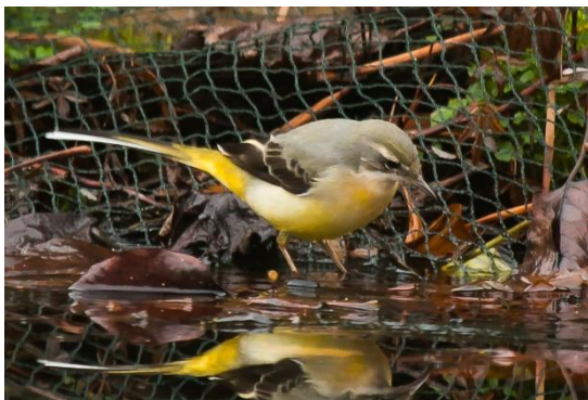
Grote Gele Kwikstaart