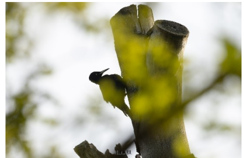
Zwarte Specht

Meer informatie kun je vinden op de website van de VWG onder Excursies . Ook deze excursie is inmiddels volgeboekt. Aanmelden kan eventueel alleen nog voor de wachtlijst via excursies@westbrabantsevwg.nl . Je aanmelding is pas definitief als je van ons een bevestiging hebt ontvangen.