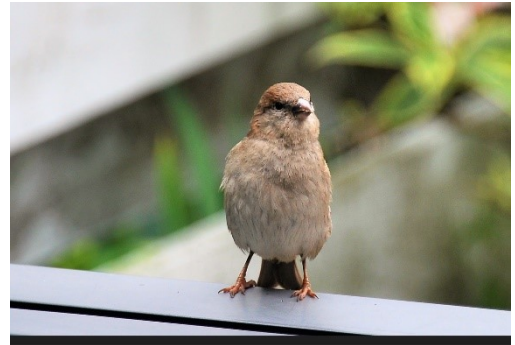
Huisumus, foto Ger Duij

https://www.vogelbescherming.nl/actueel/bericht/jaar-van-de-huismus .