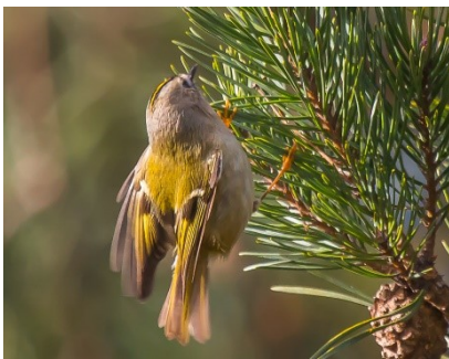
Goudhaan