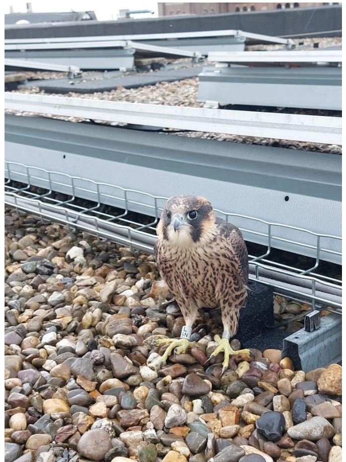
Juv. Slechtvalk Foto Raymond van Breemen.

In 2026 gaan wij gewoon door met de eerder genoemde activiteiten. Torenvalken en Slechtvalken gaan we intensief volgen en waar mogelijk broedbiologische onderzoek. In december gaan we voor de 23 ste maal het veld in voor de Integrale wintertelling roofvogels west Brabant.