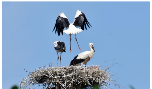
Ooievaars Asterhoeve

Over de revival van de Ooievaar in Nederland. Een boeiende lezing met bijzondere waarnemingen over gedrag, trekroutes en de overwinterende vogels. Het onderwerp sprak veel mensen aan: 50 aanwezigen. Een aanmeldingsstop was noodzakelijk omdat de lezing in een kleinere zaal dan voorheen gehouden moest worden. Tevens de laatste lezing in de Wegwijzer. Vanaf 2026 worden de lezingen in De Kievitslaar in Effen gehouden op de maandagavonden.