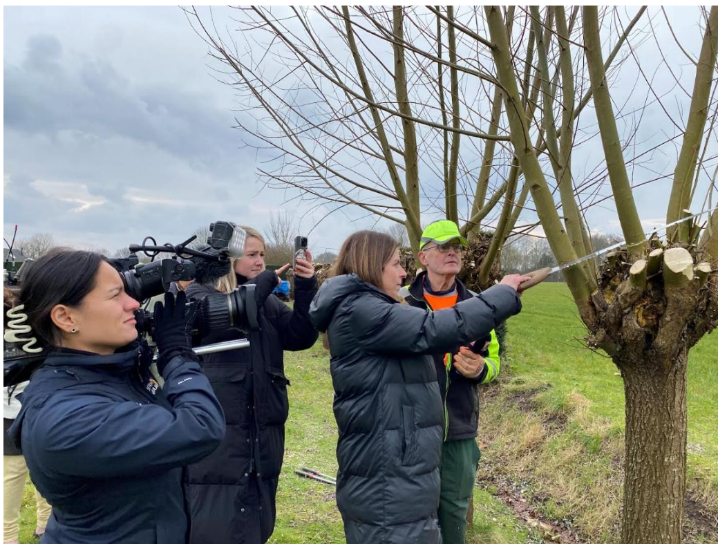
Medewerkers van Omroep Brabant aan het werk gezet in Molenschot.