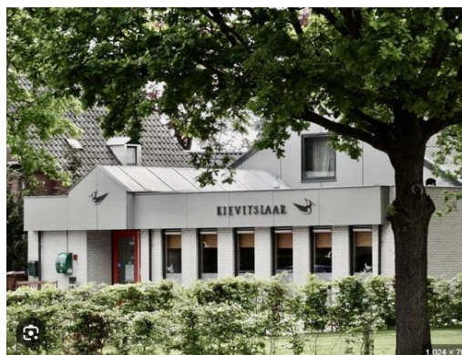
De Kievitslaar

Vrijwel al onze wensen zijn gerealiseerd. Begin 2026 starten we hier met alle activiteiten. Een frisse plek voor nieuwe ontmoetingen, nieuwe plannen en nieuwe energie.