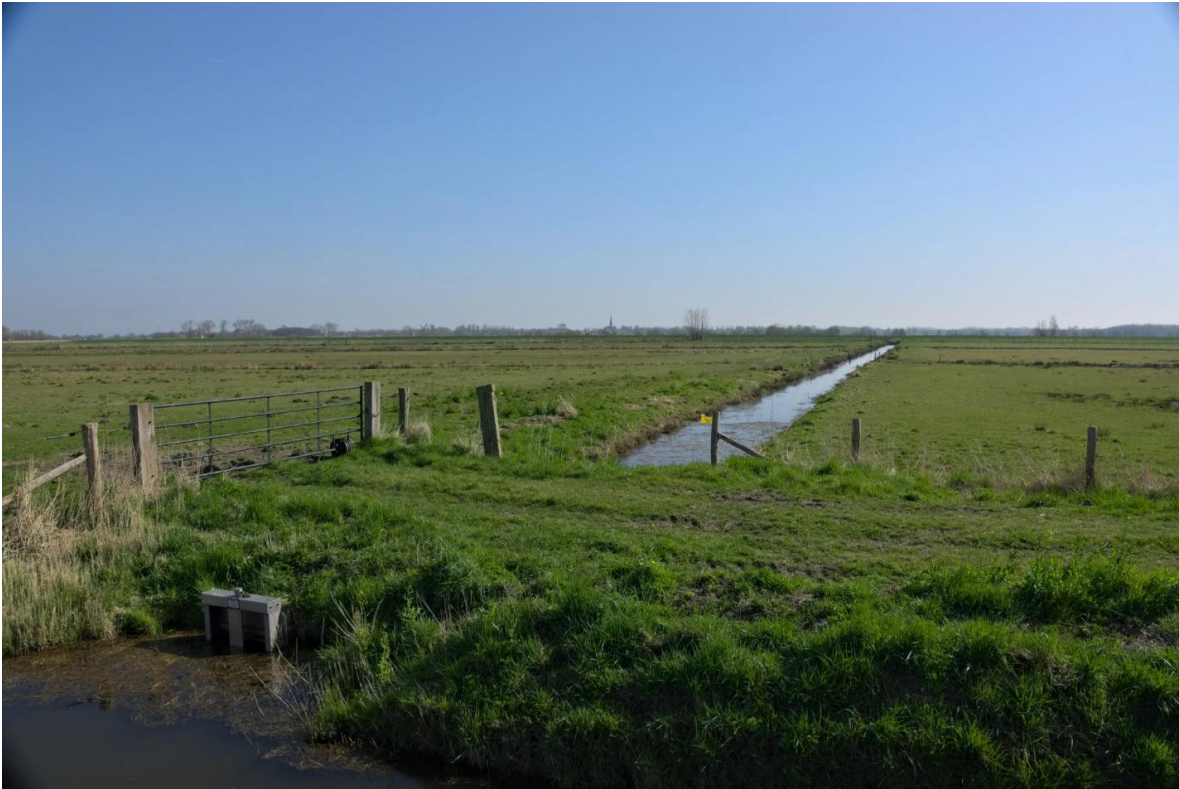
Zicht naar Terheijden over de polder Rooskensdonk