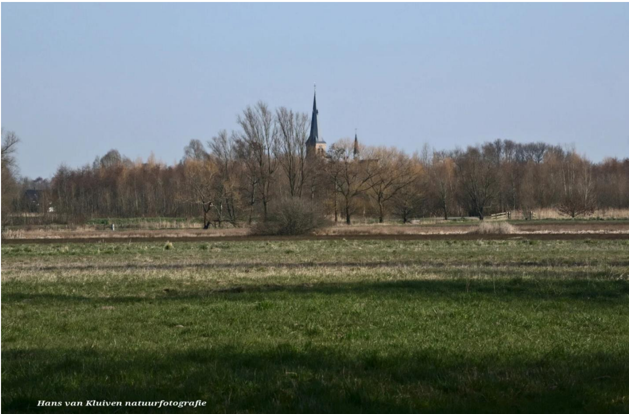
Zicht naar Terheijden over de polder Lange Bunders en Slangwijk

Ook in 2025 hebben we maandelijks de twee inventarisaties uitgevoerd. De telrondes in Vierde Bergboezem-oost en -west. De resultaten waren minder dan voorgaande jaren. In het voorjaar wordt in de Vierde Bergboezem-oost ook de BMP gelopen.