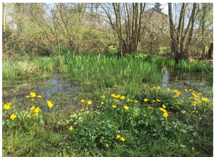
Dotterbloemen in de Kamertjes, foto Jan Benoist.

We zien gedurende al die jaren het gebied steeds vooruitgaan wat de flora en fauna betreft. Een rustpuntje in het drukke stedelijke gebied. De Kamertjes wordt naast vogels nu ook regelmatig bezocht door reeën. Steeds meer Koekoeksbloemen, Pinksterbloemen, Wateraardbeien en Gele Dotterbloemen groeien er. Er is een onderzoek uitgevoerd door Elles van Dijk naar de biodiversiteit en die is goed te noemen, zoals blijkt uit de resultaten. Er treedt verschraling op en het jarenlange maaibeheer werpt zijn vruchten af. Met de gemeente is afgesproken dat het beheer van de belangrijkste sloot wordt overgenomen door de gemeente.