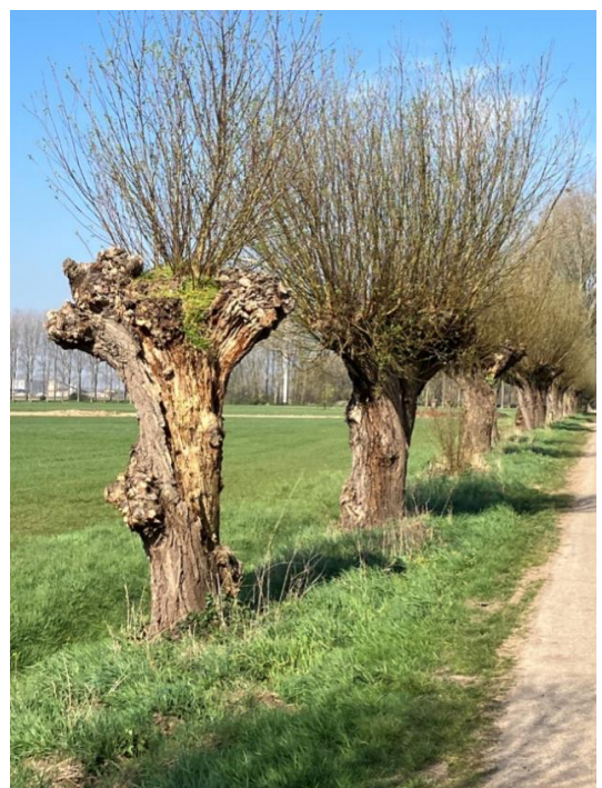
Weimeren, foto Agnes van der Sanden

Dit jaar resulteerde e.e.a. in 18 legsels, met 67 eieren, waarvan uiteindelijk 34 kuikens uit 10 legsels uitslopen. Helaas werden er 7 legsels gepreedeerd.