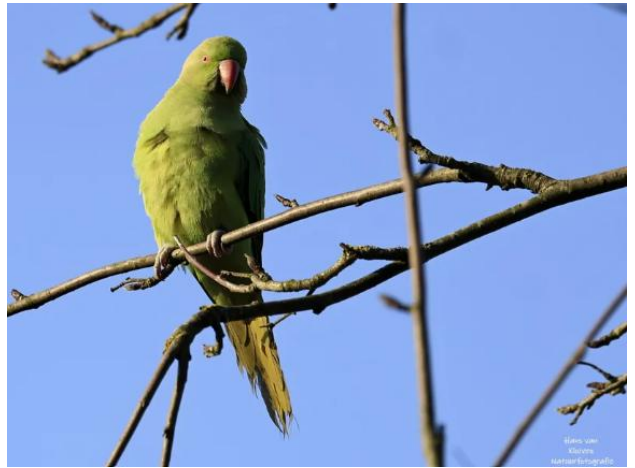
Halsbandparkiet Burgtse Dreef

Continuïteit van tellingen en goede beschikbaarheid van informatie zijn zeer belangrijk voor het onderzoek naar en bescherming van vogels in West-Brabant. Een leuk redelijk nieuw telproject waarmee vorig jaar is gestart door leden is de slaapplaatstelling van de Halsbandparkieten in de winter in Breda. Deze leden zijn van plan deze tellingen te blijven doen.