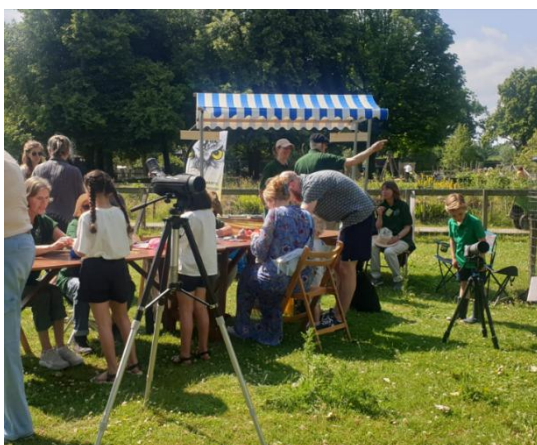
Bezoekers ontdekken via onze telescoop de rijkdom van de natuur — educatie in actie.

Maandelijks wordt er een nieuwsbrief verzonden aan de leden van de vereniging en de contacten van de West Brabantse Vogelwerkgroep. In deze nieuwsbrief worden activiteiten van de vogelwerkgroep en andere instanties op het gebied van vogels voor de komende maand vermeld. In 2025 zijn er daarnaast nog drie extra nieuwsbrieven verzonden. Hierin zijn zaken opgenomen die niet kunnen wachten tot de volgende reguliere nieuwsbrief. De samenstelling en verzending van de nieuwsbrief is verzorgd door Agnes van der Sanden en Ger Duijf.