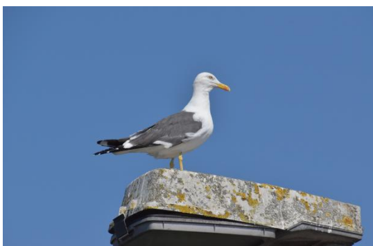
Kleine Mantelmeeuw

Zilvermeeuw en Kleine Mantelmeeuw hebben te lijden van verlies aan geschikte broedplekken o.a. door verstoring door recreatie en verwildering van gebieden, ook de vos speelt een rol. Dat is ook de reden dat de vogels broeden op daken in havens en steden. Maar daar zijn ze niet altijd welkom. Vandaar het herstelproject van drie jaar voor meeuwen in de Zuidwestelijke delta van o.a. Vogelbescherming, Natuurmonumenten, Brabantse Landschap en Vogelbescherming Vlaanderen. Klik op Zuidwestelijke Delta | Vogelbescherming voor een beschrijving van het project.