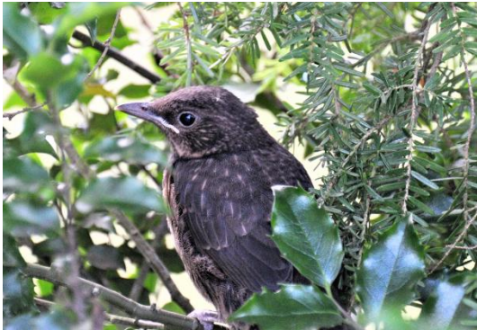
Jonge Merel

In een artikel door Janet van Zoelen van Vogelbescherming Nederland legt zij uit wat je wel en niet moet doen bij de vondst van een jonge vogel. Van mei tot juli worden Vogelbescherming en vogelopvangen, zoals in onze omgeving VRC Zundert, platgebeld met de vraag: wat moet ik doen met een gevonden vogeltje? Daarom: alles wat je wel of niet kan doen om jonge vogels te helpen in 6 vragen én antwoorden.