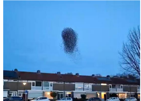
Spreeuwenwolk, foto Raymond van Breemen

Maar die spreeuwen poepen en kletsen als ze bijeen zijn. Voor de bewoners van de Buffelstraat een argument om de gemeente te benaderen en een oplossing voor hun problemen te bedenken. Daarover horen jullie meer op deze avond.