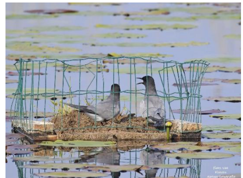
Zwarte Stern

Op zaterdag 13 juni bezoeken we, in samenwerking met de werkgroep lezingen, de Zwarte Stern kolonies in de Krimpenerwaard. We krijgen niet alleen tekst en uitleg bij het project, maar bezoeken ook het Doove Gat, een waterrijk natuurgebied met broedvogels als de Visdief, Zwartkopmeeuw en Kluut. Meer informatie kun je vinden op de website van de VWG onder excursies. Aanmelden via excursies@westbrabantsevwg.nl . Je aanmelding is pas definitief als je van ons een bevestiging hebt ontvangen.