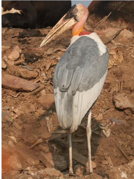
Indische maraboe

Paktai. Hier zagen we Grijsbrauwbreedbek , Bonte dwergvalk , Austens bruine neushoornvogel en de altijd lastige Spiegelpauw .