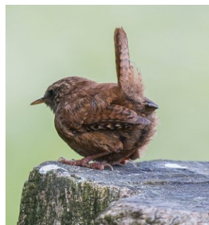
Winterkoning (Ria Lambregts)